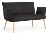
SOFT DUO UNI H40 +A