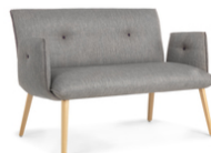
SODA DUO H40 +A