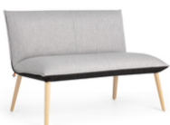
SOFT DUO BI H40 -A